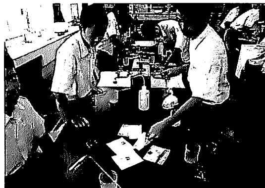
写真6 取り出したPVCフィルムの着色度合いを比較する生徒