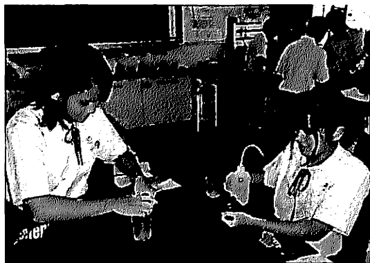
写真2 持参した衣料から絞り汁を取り出す生徒