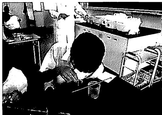
写真4 自ら調製した検液にPVCフィルムを投入する生徒