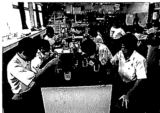
写真3 CV 溶液を駒込ピペットで量り取る生徒