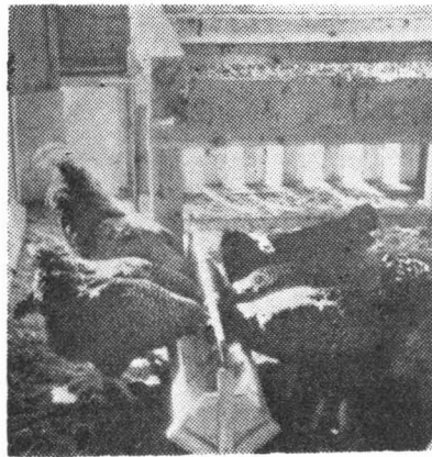
鶏の飼料も科学的に配合してやれば産卵率は高くなります

バラ粕は蛋白質の含有量が無く、且その価値も秀れている。而し欠点としては鉄物質とビタミン類特にビタミンAの含有量が少いから、之等を補給する必要がある。蛋白質飼料として乳