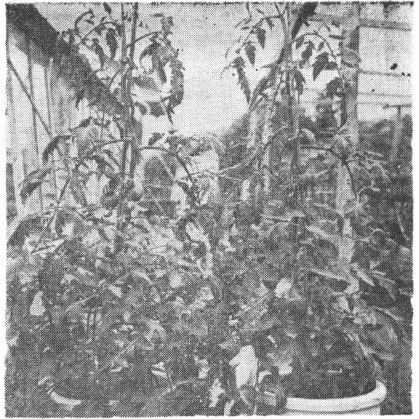
向つて左はホルモン処理された果実で右は未処理のもの。

市販のトマトリンは原液二〇cc入りで、これに二合八勺の水を加へると五十倍濃度の散布液となる、これを大体二、三花房に散布する。