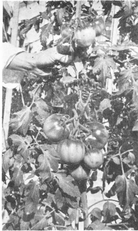
写真は琉大農学部トマト園にて