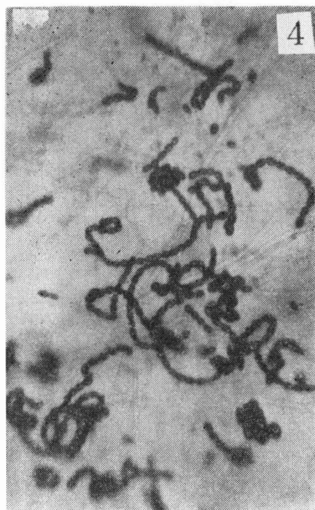
4 病原菌の大胞子（パインアツブルの苗から分離した、一五〇倍）