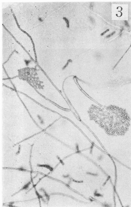
3 病原菌の小胞子（パインアツブルの苗から分離した、一五〇倍）