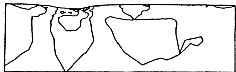
走行時の \epsilon_y の分布