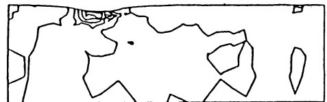
走行時の \sigma_y の分布