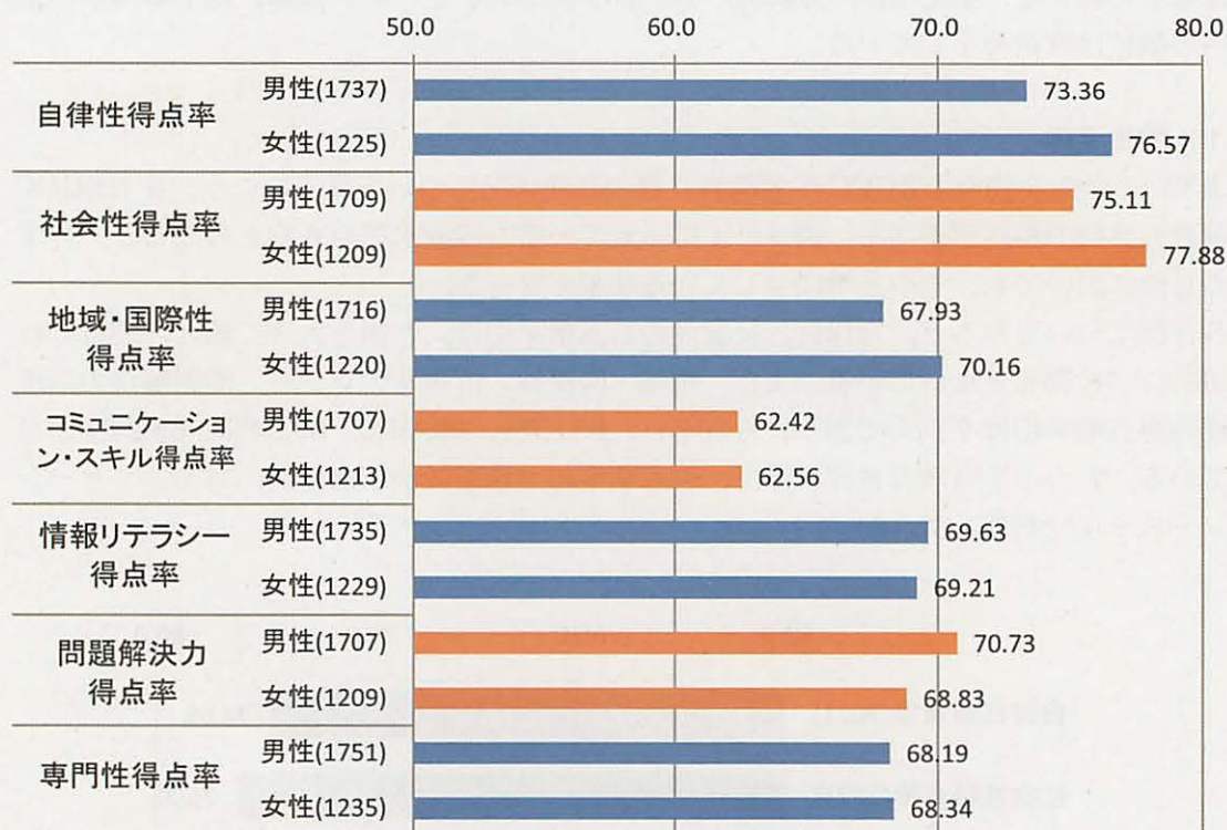
図4-2 URGCC 学習教育目標得点率の男女別平均値

一、専門性に関して男女差はなかった。また、男女ともに、いずれの目標においても達成水準の6割をクリアしている。