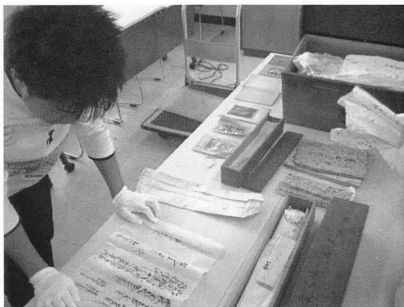
写真1 整理開始（2009年4月）