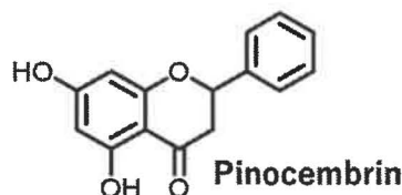
ゲットウの葉に含有する pinocembrin の構造

の発現を増加することが示唆された。これらの結果から、pinocembrin は骨粗鬆症などの骨代謝性疾患の予防および治療のためのアナボリック剤候補として大いに期待される。