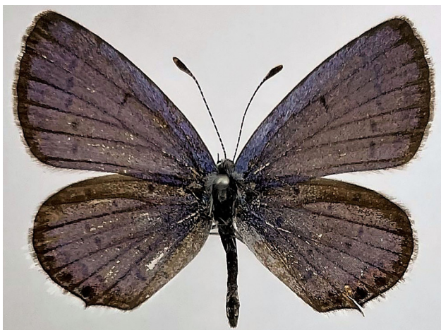
図 1. 西表島産ツバメシジミ (♂) の標本.

備考. 西表島では 1986 年 (北原 1987) と 2006 年 (西田 2007) に記録がある. 本報告は, 西表島において 3 例目の記録になる. これらの記録が, どの方面からの偶産か要調査である.